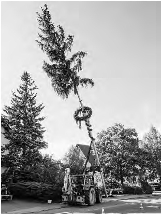
Gleich steht der Baum... – dank einer großen Helferschaft!